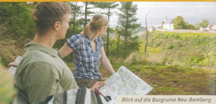
Blick auf die Burgruine Neu-Bamberg