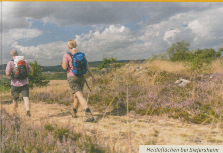
Heideflächen bei Siefersheim

GPS Start Neu-Bamberg: 49° 47'48" N 7° 55'28" E