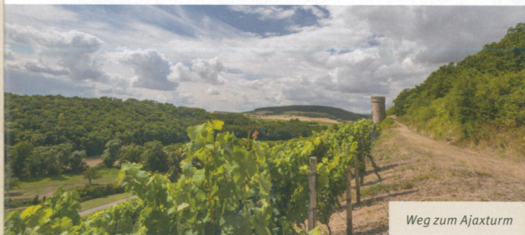
Weg zum Ajaxturm

Auf dem Weg zum Ajaxturm 2 sorgt eine abwechslungsreiche Mischung aus kultivierten Weinbergen und ursprünglichen Flächen für eine reizvolle Wegkulisse. Nach dem Turm sind es bei der Annäherung an Neu-Bamberg die Hangflanken von Galgenberg und Mühlberg, die mit markanten Steinrosseln besondere Akzente setzen.